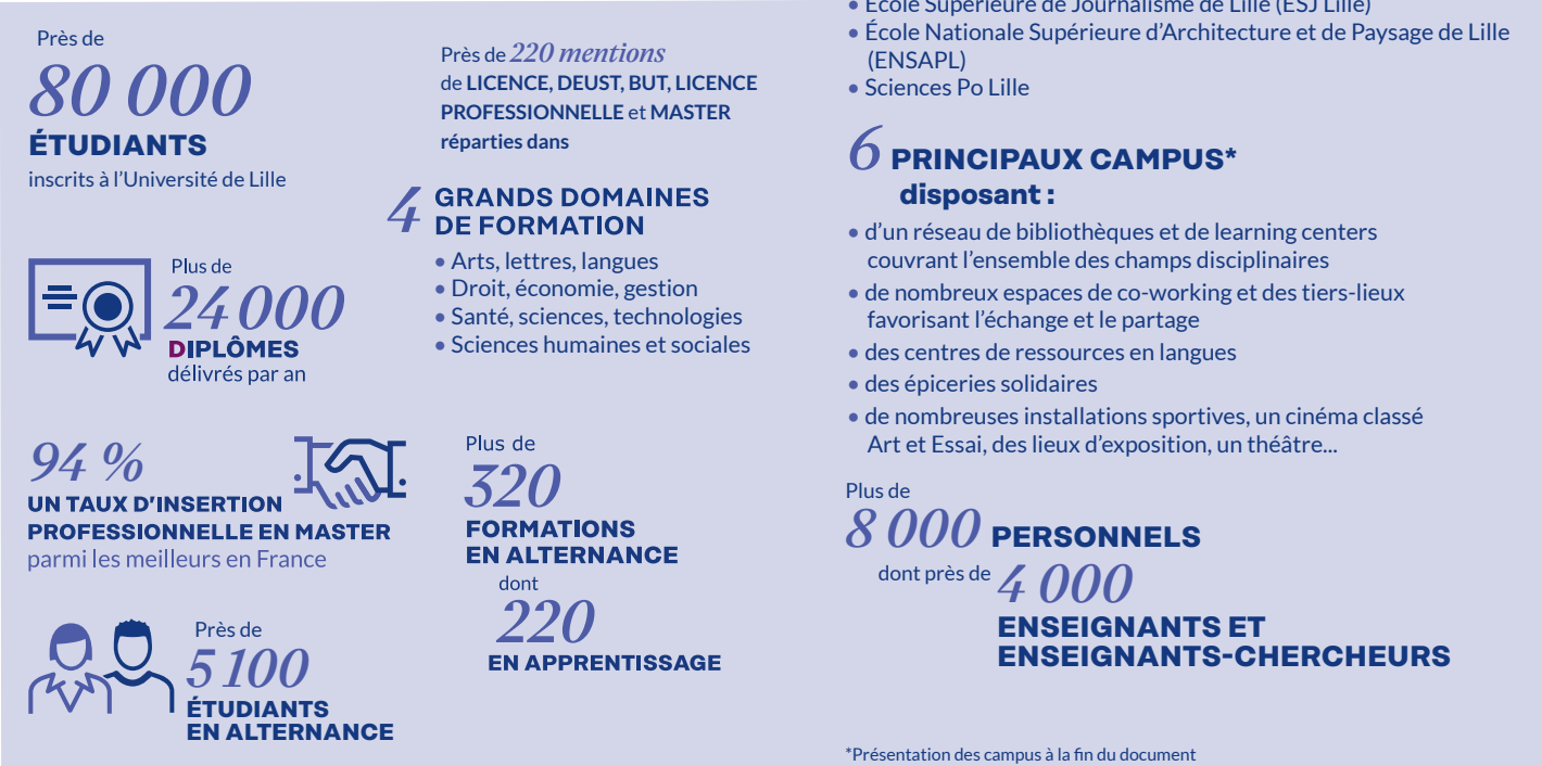
Chiffres U Lille Septembre 2025 (hors écoles composantes)

Les blocs de connaissances et de compétences Les parcours de diplôme sont organisés en blocs de connaissances et de compétences (BCC) qui se déclinent à chaque semestre en unités d'enseignement (UE). Un bloc de connaissances et de compétences représente un ensemble homogène et cohérent d'enseignements visant des connaissances et des compétences complémentaires qui répondent à un objectif précis de formation : (pluri)disciplinaire, professionnalisant, etc.